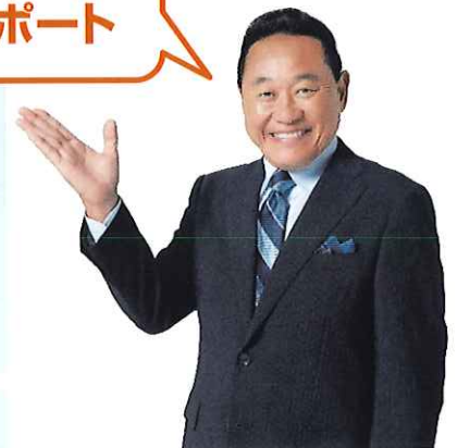
<働き方改革> 応援団長 松木安太郎